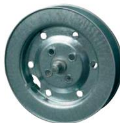
5 Eje Metálico 60 x 0.4 OCT