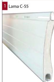
1 Lama C-55